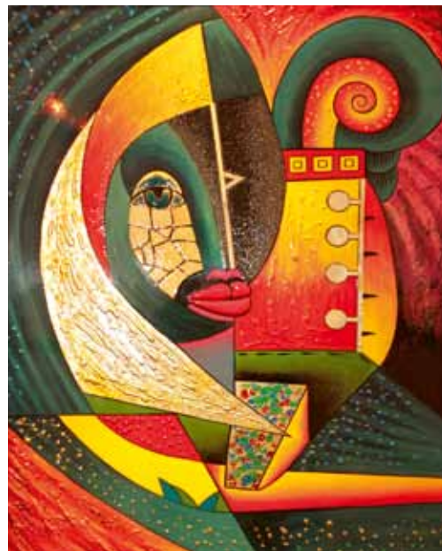
Lackmalerei im chinesischen Stil

noch durch das Essen von Schlangenfleisch und den Glauben, sich so häuten und von alternder Haut befreien zu können, wird heute auf moderne Techniken und Materialien zurückgegriffen: Botox, Hyaluronsäure oder Facelift.